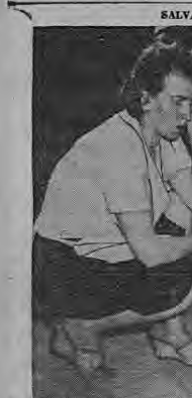
SALVADO. SEIS AMIGOS PERCEIRON